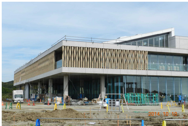
10月10日現在の工事の様子

当日の発表内容は、簡化24式と八段錦（合計15分）を予定している。今回参加できなかった方は、来年キュステのホールで元気よく表演に参加することを期待してやまない。