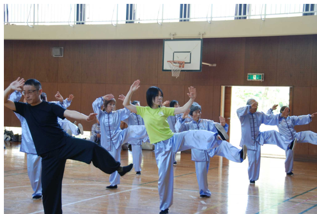
全員で「楊式88式」を表演

普段「簡化24式」の練習しかしていない初級者は、「楊式88式」は周囲を見ながら動作を合わせるのに必死だった。