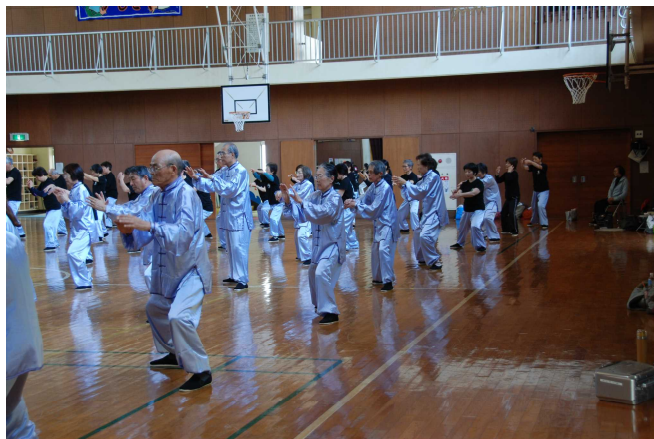
全員で簡化24式を表演

平成26年のゴールデンウィーク初日となった4月26日(土)午後1時から興津小学校体育館に於いて、「2014年太極拳合同練習」が開催された。