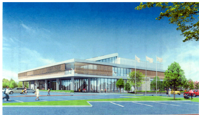
市民文化会館の完成イメージ図

完成は10月末の予定で、工事は予定通り進行していると市の関係者は言う。今年の市民文化祭の会場は、勝浦小学校の体育館で11月3日と決定。来年1月には竣工に伴った行事を計画・検討中とのこと。1月には新たなステージで練習成果を披露することになりそうだ。