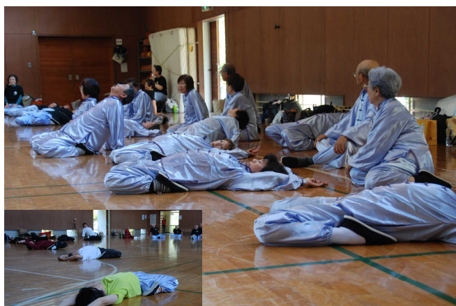
ストレッチ全体に困惑者も

山岸先生の挨拶の後、いつもの練習のように八段錦・斎法・運歩・真向法に続いて、普段はやらないストレッチ全体に挑戦した。