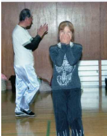
「合格」の声に喜びが・・・

今まで張り詰めていた緊張感、合格の喜びと安堵感が全身を駆け巡り、思わず顔を覆ってしまった。